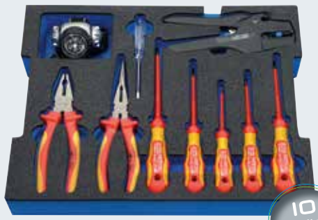
L-BOXX® A - Modul 2

Bandmaß, 3 m, mit Gürtelclip Cuttermesser, Klingenbreite 18 mm, 5 Klingen Steinmeißel 300 x 24 achtkant Eckrohrzange 1" Schlosserhammer, Fiberglasstiel, 500 g Mini-Metallbügelsäge, 150 mm/6" Blattlänge Halbrundfeile 8", 200 mm Rundfeile 8", 200 mm Measuring tape, 3 m, with belt clip Utility knife, 18 mm blade width, with 5 spare blades Stone chisel 300 x 24 octagonal Elbow pipe wrenches 1" Engineers' hammers, 500 g Mini hacksaw frame, 150 mm/6" blade length Engineers' files 8", 200 mm Engineers' files 8", 200 mm