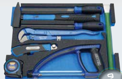
L-BOXX® B - Modul 3

Universalschlüssel Sanitär/Elektro / Durchstecknarre 1/2" Mini-Rohrabschneider 3 - 25 mm / Teleskop-Rohrabschneider 3 - 32 mm Rohrentgrater innen/ausen 42 mm / Knarrenrohrabschneider Ø 22 mm Verlängerung 1/2", 125 mm / Sanitär-Kreuzschlüssel Schraubendreher-Einsätze 1/2" • 12/17, 138 mm Steckschlüssel-Einsätze 6-kt. \text{Ø}_{\text{max}} 10/13/17/19/21/22 Express-Schlüssel \text{Ø}_{\text{max}} 17 x 19 / Stufenschlüssel 3/8" - 1" Standhandmutternschlüssel mit 6 Einsätzen \text{Ø}_{\text{max}} 9/10/11/14/15/17 mm Universal control cabinet key sanitary/electric / Ratchet 1/2" Mini tube cutter 3 - 25 mm / Telescopic tube cutter 3 - 32 mm Tube trimming tool outside/inside 42 mm / Ratchet tube cutter Ø 22 mm Extension bars 1/2", 125 mm / Sanitary cross wrench Screwdriver sockets 1/2" • 12/17, 138 mm Sockets, hexagon \text{Ø}_{\text{max}} 10/13/17/19/21/22 Sanitary wrench \text{Ø}_{\text{max}} 17 x 19 / Combination stepped key 3/8" - 1" Basin wrench with 6 sockets \text{Ø}_{\text{max}} 9/10/11/14/15/17 mm