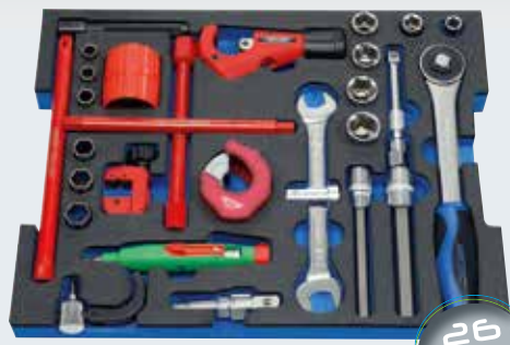
L-BOXX® A - Modul 1

L-BOXX®-A/Modules 1+2 with 36 tools L-BOXX®-B/Modules 3+4 with 44 tools