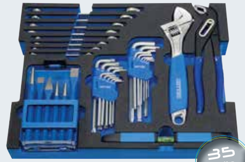
L-BOXX® B - Modul 4

VDE Kombinationszange, 180 mm / VDE Flachrundzange, gerade, 200 mm Spannungsprüfer 150-250 V / Stirnlampe mit 9 LED's, Gurtband VDE Kreuzschlitzschraubendreher PZ 1 / PZ 2 VDE Elektrikerschraubendreher Schlitz 75 x 2,5 / 100 x 4,0 / 125 x 5,5 Automatische Abisolierzange, 180 mm VDE Combination plier, 180 mm / VDE Snipe nose plier, straight, 200 mm Voltage tester 150-250 V / Headlamp with 9 LED's, adjustable elastic support VDE-Screwdriver PZ 1 / PZ 2 VDE-Screwdriver 75 x 2,5 / 100 x 4,0 / 125 x 5,5 Automatic wire stripping plier, 180 mm